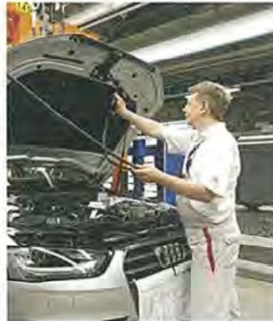
Arbeit im Motorraum heute