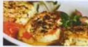
Gebackener Schafskäse mit Tomaten und Zwiebeln 7,50