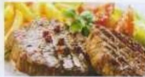
Steak in Pfeffersoße mit Pommes frites und Salat 16,90