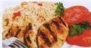
Hähnchenbrust mit Reis und Gemüse 11,90