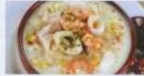
Französische Fischsuppe 8,00