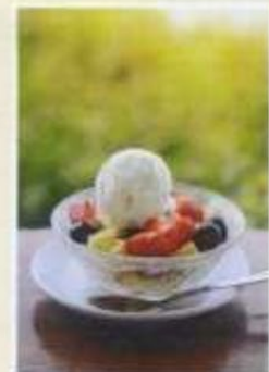
Obstsalat mit Eis 4,50