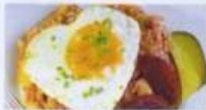
Labskaus „Seemannsart“ mit Spiegelei, Gewürz- gurke und Hering 12,90