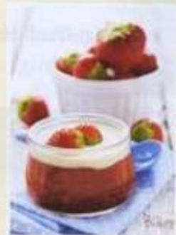
Rote Grütze mit Vanillesoße 4,50