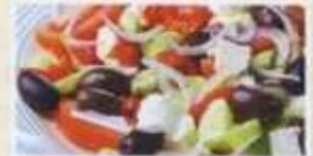
Großer Salat mit Schafskäse und Oliven 8,50