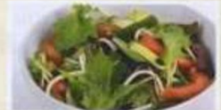
Kleiner gemischter Salat 4,50