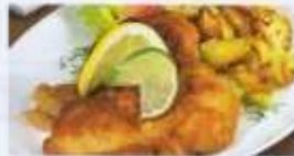
Schnitzel „Wiener Art“ mit Bratkartoffeln und Salat 12,90